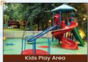
Kids Play Area