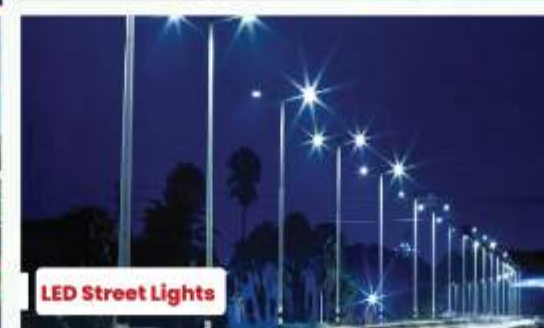
LED Street Lights

Disclaimer: This is an Artistic / Architectural presentation of the Project which may change during the course of development.