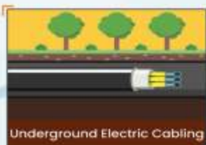
Underground Electric Cabling