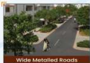
Wide Metalled Roads