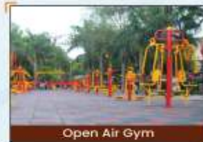
Open Air Gym