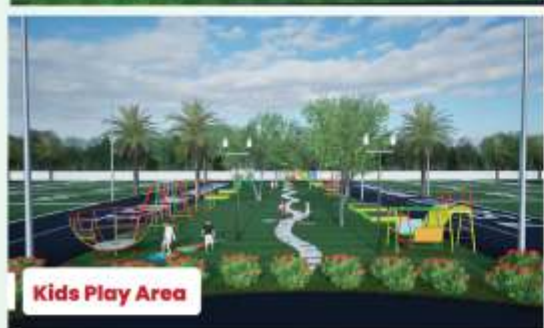
Kids Play Area