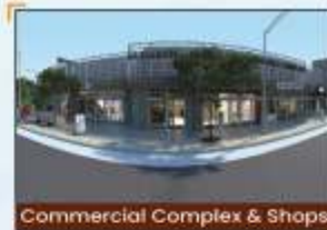
Commercial Complex & Shops