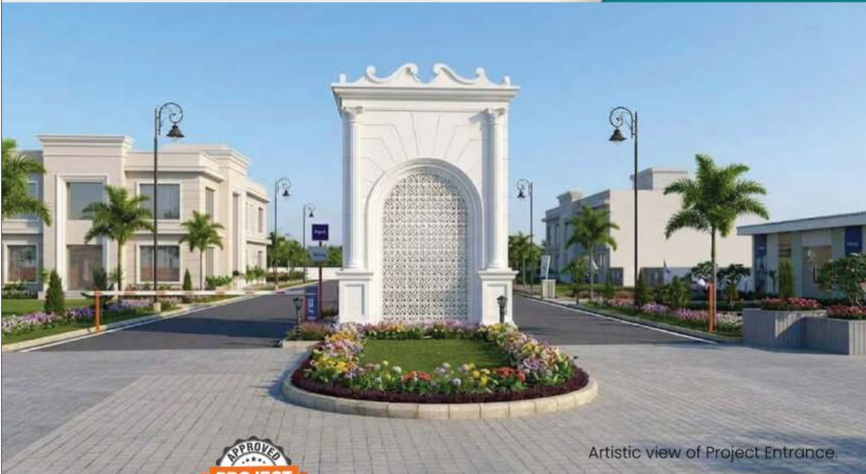
Artistic view of Project Entrance.