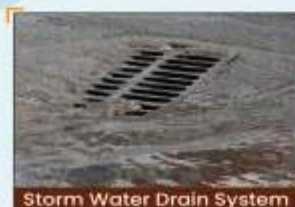
Storm Water Drain System