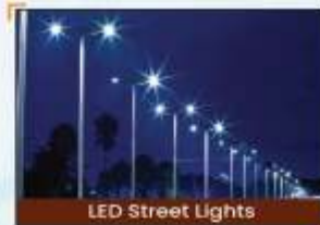
LED Street Lights