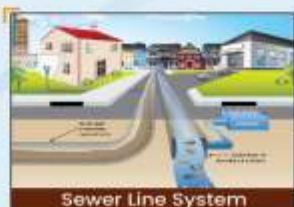
Sewer Line System