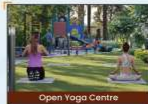
Open Yoga Centre