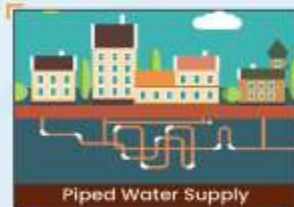
Piped Water Supply