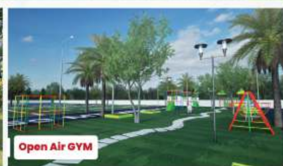
Open Air GYM